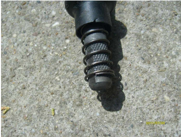
Váltókar gomb nélkül.

Az új váltógombhoz amit vásároltam kaptam különféle alumínium és gumi adaptereket, amelyeket a váltókar végére hernyócsavarokkal lehet rögzíteni, aztán a gombot egyszerűen már csak rá kel csavarni. Ime: