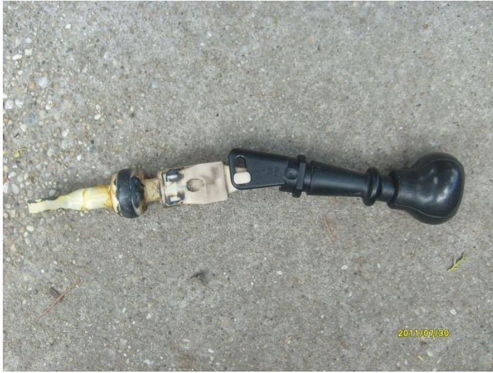
Váltókar a régi gombbal.

A váltókar kivételére pedig azért van szükség, mert a régi (gyári, ráöntött) gombot csak a „legyilkolós” (fűrész, flex, kés... stb) módszerrel tudjuk eltávolítani.